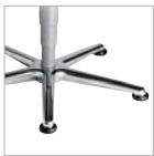
Aluminium- fußkreuz poliert